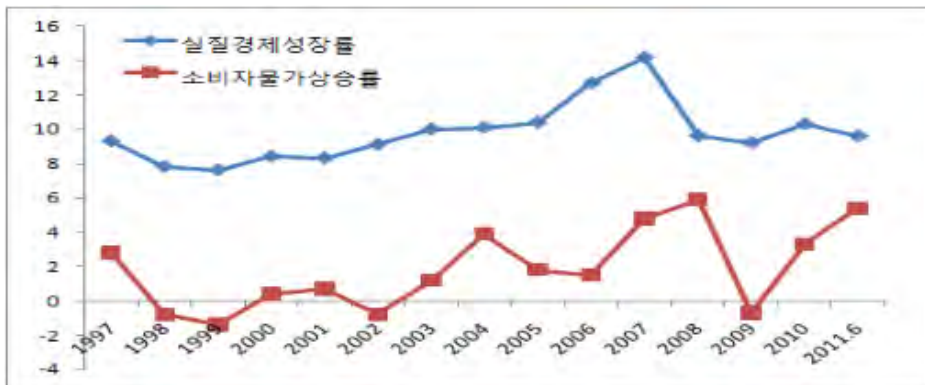
[그림 2] 연도별 성장률과 물가상승률

최근 중국 거시경제의 불확실성을 얘기할 때 가장 먼저 제기되는 것은 물가상승 즉, 인플레이션 문제이다. 중국의 소비자 물가지수는 2011년에 들면서 빠르게 상승하기 시작하여 4퍼센트에서 5퍼센트로 7월과 8월에는 6퍼센트대로 급상승하였다. 8월 소비자물가상승률이 다행히 전월의 6.5퍼센트보다 다소 낮은 6.2퍼센트로 꺾였다고는 하지만 물가상승에 대한 불안감이 여전한 상황이다. 이러한 물가의 급상승은 중국 거시경제에 대한 우려, 나아가 중국경제의 향후 발전전망을 불안하게 만드는 중요한 요인이다. 예를 들면 많은 중국인들이 집값이 높기 때문에 집을 살 수 있는 여력이 없으며, 주택에 대한 부담으로 소비여력이 현저하게 약화되었다. 최근의 식품가격 폭등은 중국에서 심각한 사회문제가 되고 있고, 사회적 불안요인으로 지적되고 있다. 더구나 중국은 2000년대 중반까지는 물가상승률이 매우 낮게 유지되는 국가였다. 경제성장률이 두 자리수를 기록하면서도 물가상승률이 거의 0퍼센트에 가깝게 낮게 유지되는 매우 안정적인 성장 모습을 보여주었기 때문에 최근의 높은 물가상승률에서 느껴지는 불안감이 더욱 크다.