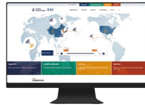
웹사이트 바로가기 : www.globalnk.org

EAI는 2018년 “대북 복합전략 영문 웹사이트” Global NK를 구축하여 관리하고 있습니다. 본 웹사이트는 외부 기관의 북한 관련 발간자료를 한 곳에 수집하는 아카이브 역할을 비롯하여 주요 국가의 인식 차이를 통계로 분석하고 전문가 코멘터리를 제공하는 등 북한문제의 방향성을 제시하고 있습니다.