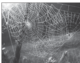
▲ 나. 이중그물망