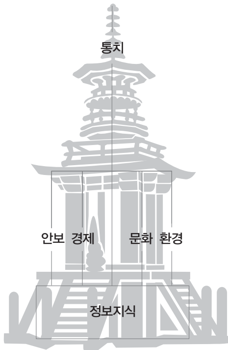
[그림 2] 3층 복합 다보탑

중심층 무대에 대해 정보지식이 독립변수로서 영향을 주기 시작했다. 그럼에도 불구하고 탑륵부 상층의 통치무대는 여전히 최종 통제탑의 기능을 하고 있다. 결국 이렇게 다보탑처럼 아름다운 3층의 복합무대를 쌓지 못하고서는 21세기 무대의 중심에 설 수 없다.