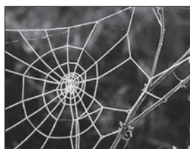
▲ 가. 단순그물망