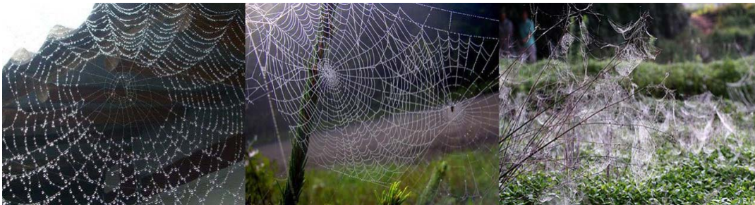
[그림 1] 단순그물망과 복합그물망

다음으로 복합무대를 다보탑의 은유를 통해서 살펴보겠다. 안보와 번영이 19세기의 전통 무대였다고 하면 21세기에는 안보와 번영의 부국강병 무대와 함께 무분별한 성장으로 인한 지구적 피해를 막으려는 환경무대, 군사위협 완화와 함께 드러나는 주인공들의 정체성 차이가 표출되는 문화무대가 아래 [그림 2]에서 보는 것과 같이 다보탑 중심층 무대의 네 꼭지에 자리 잡고 있다. 그리고 21세기 정보지식무대가 기층 무대를 구성하고 있다. 경제가 아니라 정보 지식 무대가 기층 무대가 되는 이유는 과거의 역사를 돌아보면 알 수 있다. 기원 전후 세계의 주요 종교가 등장했던 시기에는 종교가 당시 삶의 기층무대를 형성했으며, 근대 정치혁명의 시대에는 정치가 삶의 기반을 우선적으로 구성했으며, 산업혁명 이후 서양 자본주의의 폭발적 성장과 함께 경제가 역사의 기층무대 역할을 했다. 그런데 21세기는 첨단 과학기술의 혁명적 변화로 4대 중심층 무대에 대해 정보 지식이 독립변수로서 영향을 주기 시작했다. 그럼에도 불구하고 탐문부 상층의 통치무대는 여전히 최종 통제탑의 기능을 하고 있다. 결국 이렇게 다보탑처럼 아름다운 3층의 복합무대를 쌓지 못하고서는 21세기 무대의 중심에 설 수 없다.